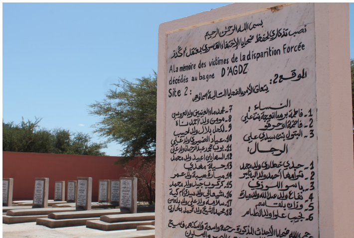
Stèle commémorative et enterrement des victimes de l'ancien bagne d'Agdez dans un cimetière qui leur est dédié