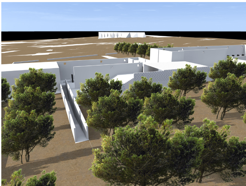
Development of the former Tazmammart prison, including a cemetery and a socio-cultural center for the village, to transform it, in consultation with NGOs, into a space for developing economic, social and environmental initiatives and activities.