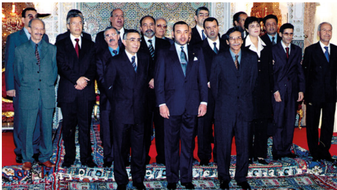
Members of the Equity and Reconciliation Commission