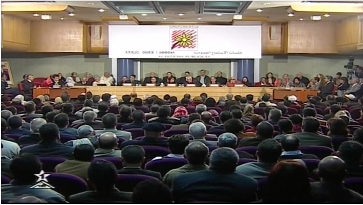
جلسات الاستماع العمومية