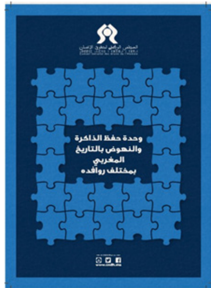
Unité de Mémoire créée par le CNDH

Le rapport présente les résultats des investigations qui ont permis d'élucider le sort d'un certain nombre de personnes disparues et celles au sort inconnu.