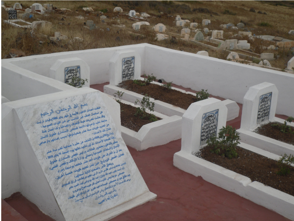
نصب تذكاري وتهيئة قبور ضحايا أحداث يناير 1984 بالناظور